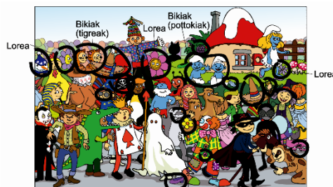
1-f, 2-h, 3-g, 4-a, 5-e, 6-d, 7-b, 8-c

Marra baten bidez, lotu elur-panpin bakoitzari falta zaion elementua.