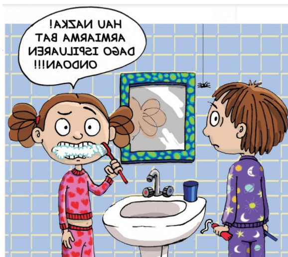
Hau nazka! Armiarma bat dago ispiluaren ondoan!!!