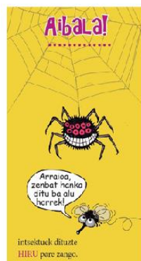
Armiarmak lau pare zango ditu eta araknidoa da, ez intsektua.