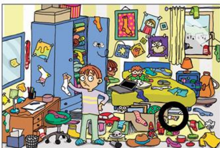
Biribil faltsua: 4.